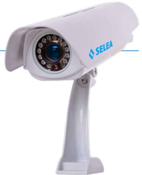
TABELLA COMPARATIVA delle differenze principali